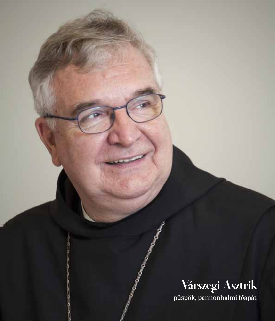
Várszegi Asztrik püspök, pannonhalmi főapát